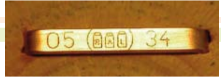
Abb. 3b: RAL-Produktkennzeichnung mit Klammer (Muster)

Vor Bläuepilzen schützt Kesseldruckimprägnierung allerdings nicht immer (ggf. zusätzlicher Bläueschutzanstrich erforderlich). Bei gewünschter Änderung des Farbtons ist Nachstreichen mit einem schadstoffarmen Anstrichmittel ausreichend.