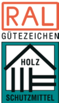
Abb. 1: RAL-Gütezeichen 830

Unter Mitwirkung amtlicher Stellen geprüfte Holzschutzmittel sind sicher erkennbar am RAL-Gütezeichen „Holzschutzmittel“ gemäß RAL-GZ 830 (Abbildung 1) oder an der Registriernummer des Umweltbundesamtes (z.B. UBA-Reg-Nr. 3000).