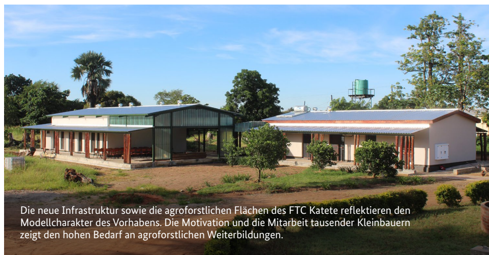
Die neue Infrastruktur sowie die agroforstlichen Flächen des FTC Katete reflektieren den Modellcharakter des Vorhabens. Die Motivation und die Mitarbeit tausender Kleinbauern zeigt den hohen Bedarf an agroforstlichen Weiterbildungen.